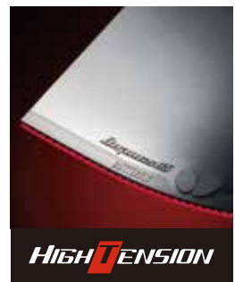
より高いレベルのプレーへと導く ハイテンション裏ラバー