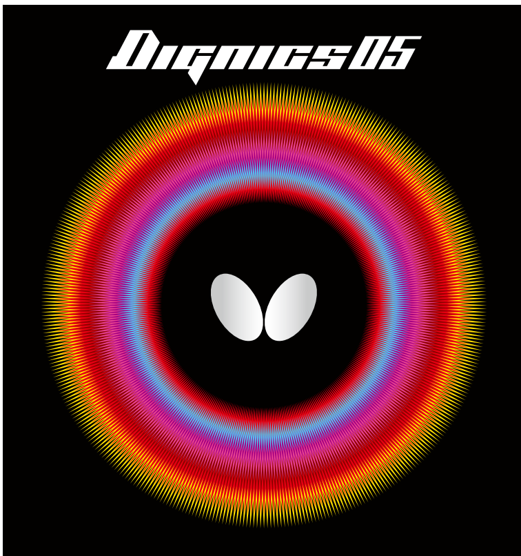
ディグニクス05のパッケージ

発売は2019年春を予定しております。製品の詳しい情報を、バタフライ・ホームページ(butterfly.co.jp)にて公開中です。