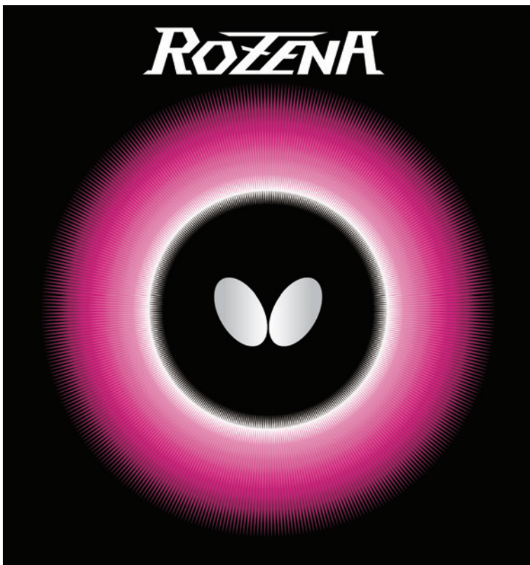
ROZENA《ロゼナ》のパッケージ

ITTFの公認は4月1日付となる予定です。製品に関してのより詳しい情報は、4月初旬よりホームページなどで順次公開いたします。